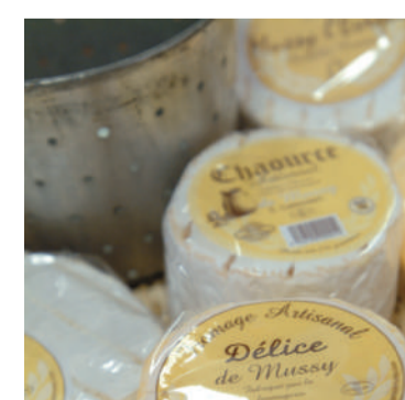
CHAOURCE-KAAS De Chaource is een kaas met Beschermde Oorsprongsbenaming. Het is een eeuwenoude kaas dankzij de kaasmakerijtraditie in de streek.