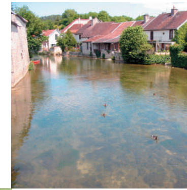
ESSOYES Charmant dorpie wiens landschappen en licht Renoir inspireerden voor zijn werk.