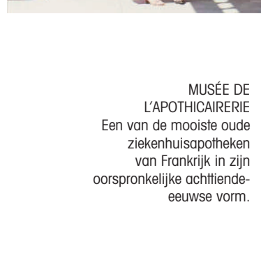
MUSEE DE L'APOTHICAIERE Een van de mooiste oude ziekenhuisapotheken van Frankrijk in zijn oorspronkelijke achttiende-eeuwse vorm.