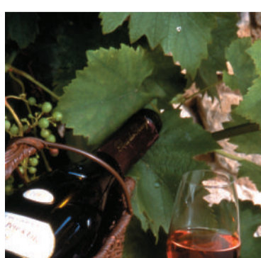
ROSE DES RICEYS Lodewijk XIV was een liefhebber van deze unieke en prestigieuze champagnewijn. Zijn zeldzaamheid is het enige minpunt...