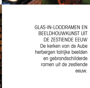
GLAS-IN-LOODRAMEN EN BEELDHOEWKUNST UIT DE ZESTIENDE EEUW De kerken van de Aube herbergen talrijke beelden en gebrandschilderde ramen uit de zestiende eeuw.