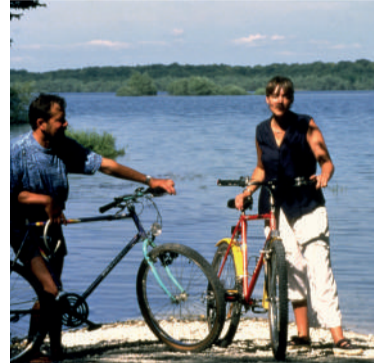
Fietspaden op veldwegen en op eigen terrein 2 Fietsroutes 'Vélovoies' op eigen terrein: de ene verbindt Troyes met de Lacs d'Orient en de andere verbindt Troyes met Nogent-sur-Seine via het Canal de la Haute Seine. 24 fietsroutes.