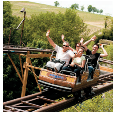
NIGLÖLAND Derde grootste attractiepark van Frankrijk in een uitzonderlijk groen kader.