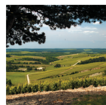
PLATEAU VAN BLÔ Prachtig uitzicht over de champagnewijngaard met oriëntatietafel en picknickzone.