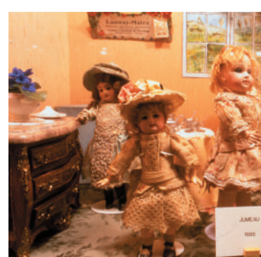
MUSEE DES POUPÉES D'ANTAN ET DE LA TONNELLERIE (POPPEN VAN WROEGER EN KUIPERIJ) in Maisons-les-Chaources Grote collectie poppen met porselein hoofd uit de jaren 1850-1950, kuiperij-atelier, trouwerijen in 1900, oude wasmachines, oude melkerij, dameshoedenwinkel.