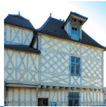
HENDRIK IV PAVILJOEN In Nogent-sur-Seine Volgens de legende zouden geliefden Hendrik IV en de mooie Gabriëlle d'Estrees elkaar hier in het geheim ontmoet hebben.