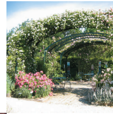
BOTANISCHE TUIN in Marnay-sur-Seine Een schitterend behoudsinstituut voor de biodiversiteit met meer dan 3000 verschillende plantensoorten op 4000 m 2 oppervlakte.