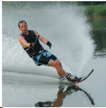
WATERSPORTEN OP DE MEREN VAN LA FORET D'ORIENT Zeilen, jetski, waterskiën, pedalo, zwemmen...