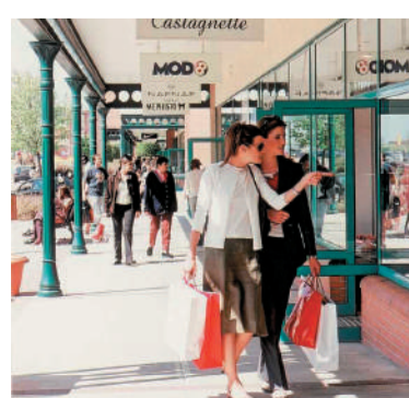
OUTLETCENTRA MET TOPMERKEN 3 outletcentra met topmerken met meer dan 250 winkels en 400 merken.