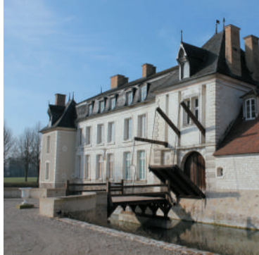
KASTEEL VAN DROUPT-SAINT-BASLE Historisch monument uit de zestiende en achttiende eeuw