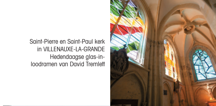
Saint-Pierre et Saint-Paul kerk in VILLENAUXE-LA-GRANDE Hedendaagse glas-inloodramen van David Tremlett