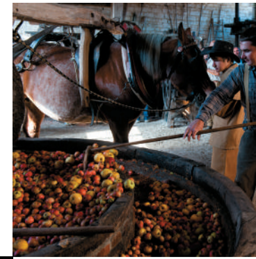
CIJDER UIT DE OTHE De cidre uit de Othe wordt gemaakt met een fiental appressen is en fruitig en friszuur van smaak.