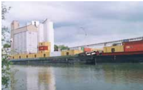
Port fluvial de Nogent-sur-Seine