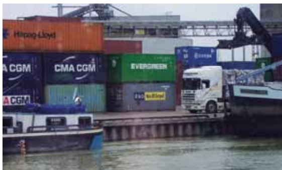
Plateforme tri-modale de Nogent-sur-Seine