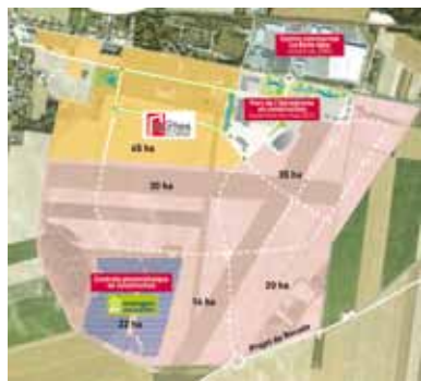
Parc d'activités économiques de l'aérodrome de Romilly-sur-Seine