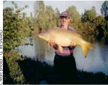
Carpe commune de 13 kg à La Pâtüre