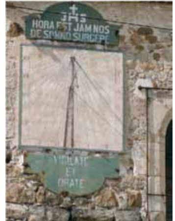
Cadran solaire, Bercenay-le-Hayer