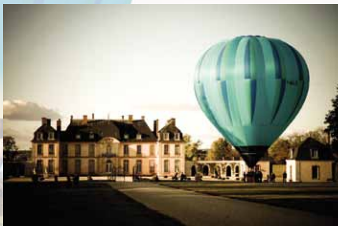
Château de la Motte-Tilly