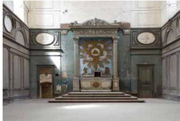
L'abbaye de Clairvaux - réfectoire - chapelle

Dans l'Aube en Champagne, vous pourrez découvrir l'abbaye de Clairvaux, haut-lieu de l'histoire religieuse et site imprégné de la spiritualité cistercienne, les caves de champagne et les vigneron passionnés, les paysages viticoles apaisants ou encore le musée du Cristal de Bayel, situé à côté de l'ancienne Cristallerie Royale de Champagne.