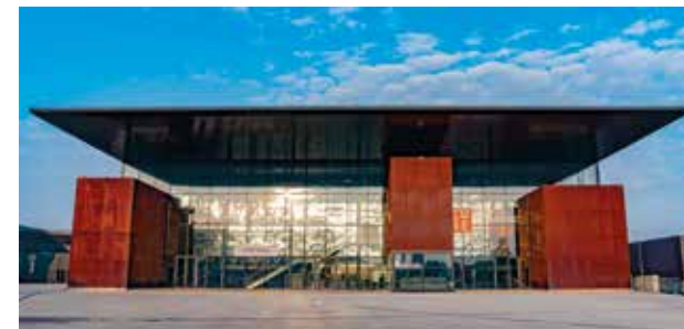
Le Cube Troyes Champagne Expo