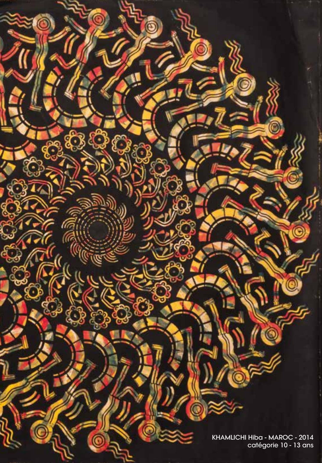
KHAMLICHHI Hiba - MAROC - 2014 catégorie 10 - 13 ans