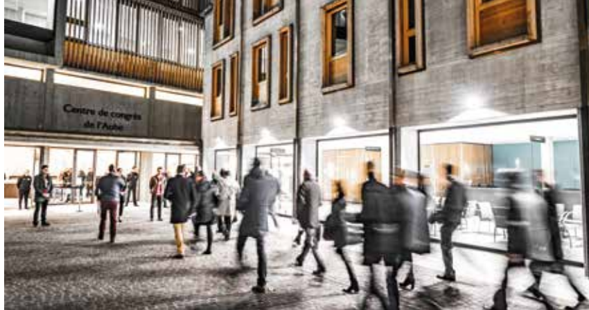
Le Centre de congrès de l'Aube