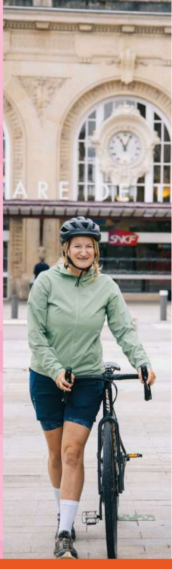
véhicules en libre service à chaque arrêt

Pour réserver son vélo à Troyes : Le Marcel à vélo dans les autres gares : vélo fluo Grand Est